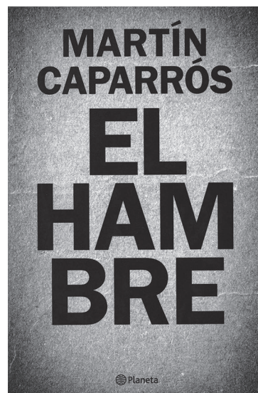
CAPARRÓS, Martín. El Hambre . México, Planeta, 2014.

Caparrós explica la evolución de la alimentación del hombre desde la prehistoria y el hambre como forma de dominación en algún punto de la historia, así como la fisiología de la muerte por inanición. Relata cómo las grandes potencias han terminado históricamente con economías débiles, con su industria, y han arruinado a los campesinos en distintas economías del mundo con la implantación de programas engañosos que les prometían una vida mejor. Recorre el desarrollo del capitalismo que ha conducido