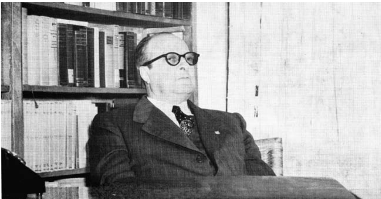
Lic. Jesús Silva Herzog, tercer Director de la Escuela Nacional de Economía (1940-1942).

El tercer director de la entonces Escuela Nacional de Economía fue Jesús Silva Herzog, (1940-1942). Sus primeros estudios los realizó en el Seminario de San Luis Potosí, posteriormente en una Escuela de Negocios de Nueva York y en la Facultad de Altos Estudios de México. Jesús Silva Herzog fue jefe del Departamento de Bibliotecas y Archivos Económicos de la Secretaría de Hacienda y Crédito Público, secretario de la misma institución y fundador del Instituto Mexicano de Investigaciones Económicas. Fue él quien reorga-