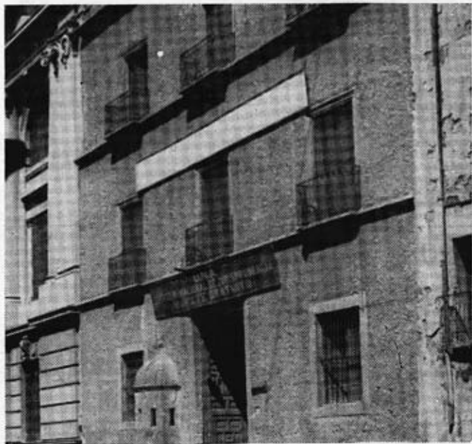
Anexo de la Facultad de Derecho y Ciencias Sociales, en la Calle de San Ildefonso, local de la Escuela Nacional de Economía de fines de 1935 a fines de 1936.

Como se mencionó antes, en 1929 fue creada en el país la institución universitaria más antigua dedicada a la enseñanza de la ciencia económica y, por consiguiente, el primer programa de economía en México. Diferentes administraciones, profesores y estudiantes han contribuido y dado los pasos necesarios para su desarrollo.