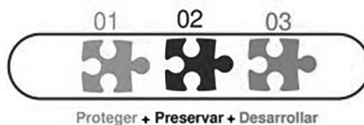
Imagen 4. Cuidado resiliente. Adaptación del modelo MAR por las autoras.

Este modelo hace énfasis en las personas y en el cuidado resiliente de la organización, el cual pretende: