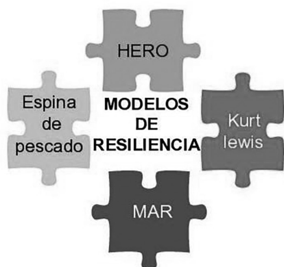
Imagen 3. Modelos de resiliencia organizacional. Elaborado por las autoras.

Cada uno de estos modelos brindan perspectivas interesantes. Sin embargo, el que más se usa en el área de servicios es el Modelo MAR (Modelo de Acción Resiliente), el autor es Fernando Véliz Montero y adaptó este nombre porque el mar genera en la mayoría de las personas una sensación de bienestar y felicidad. 8